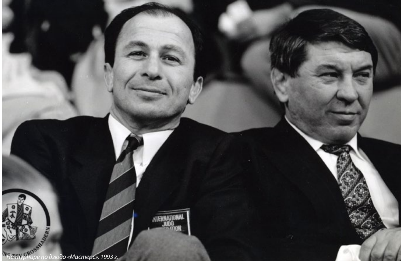
На турнире по дзюдо «Мастерс», 1993 г.