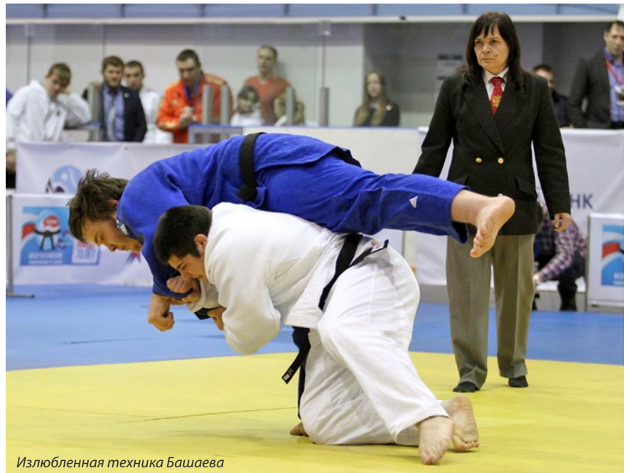
Излюбленная техника Башаева

— Год 2015-й заканчивается клубным чемпионатом Европы. Молодой клуб «Эдельвейс», в составе которого Вы боретесь,