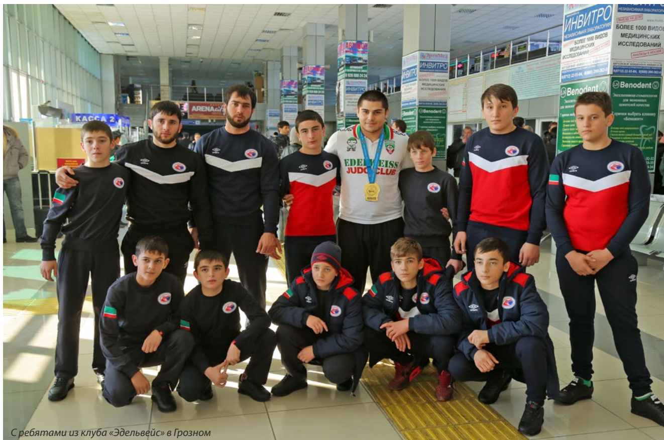
С ребятами из клуба «Эдельвейс» в Грозном