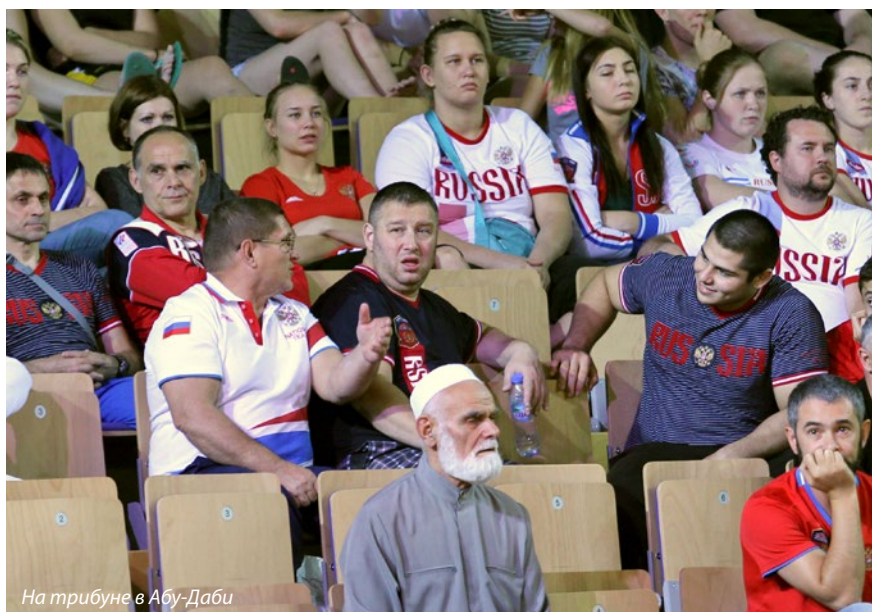
На трибуне в Абу-Дави

— Встречается. У нас принято давать ребёнку имя хороших, известных людей. В честь кого точно меня назвали, я не знаю, но думаю, что в честь Тамерлана-завоевателя.