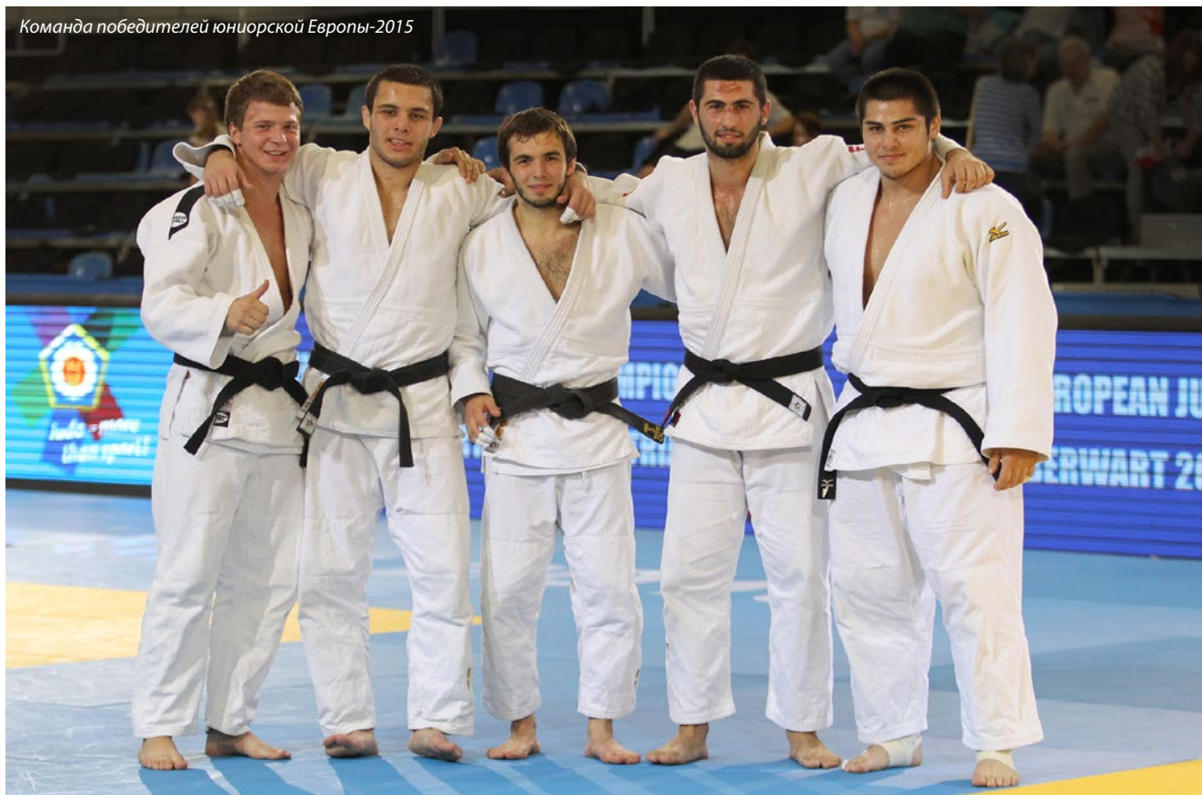
Команда победителей юниорской Европы-2015

всему отечественному дзюдо и России в целом, празднующим победу россиянина на самом престижном турнире в самой престижной категории.