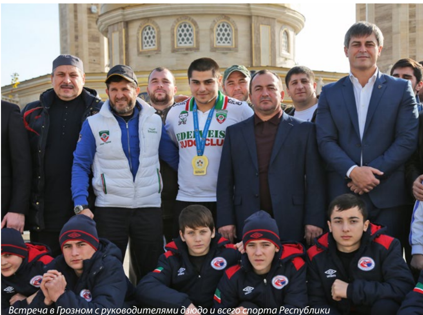
Встреча в Грозном с руководителями дзюдо и всего спорта Республики

— Я считаю, что нужно с головой подходить к тренировочному процессу. Не пропускать занятий, всегда хорошо делать разминку. Некоторые легкомысленно к ней относятся, а потом мучаются от полученных травм. А с травмами стать трёхкратным олимпийским чемпионом очень тяжело. Во-вторых, нужно работать с хорошим тренером, доверять ему. Тренер — человек, у которого есть знания и опыт, и надо впитывать их от него. Всегда надо спрашивать у того, кто больше знает.