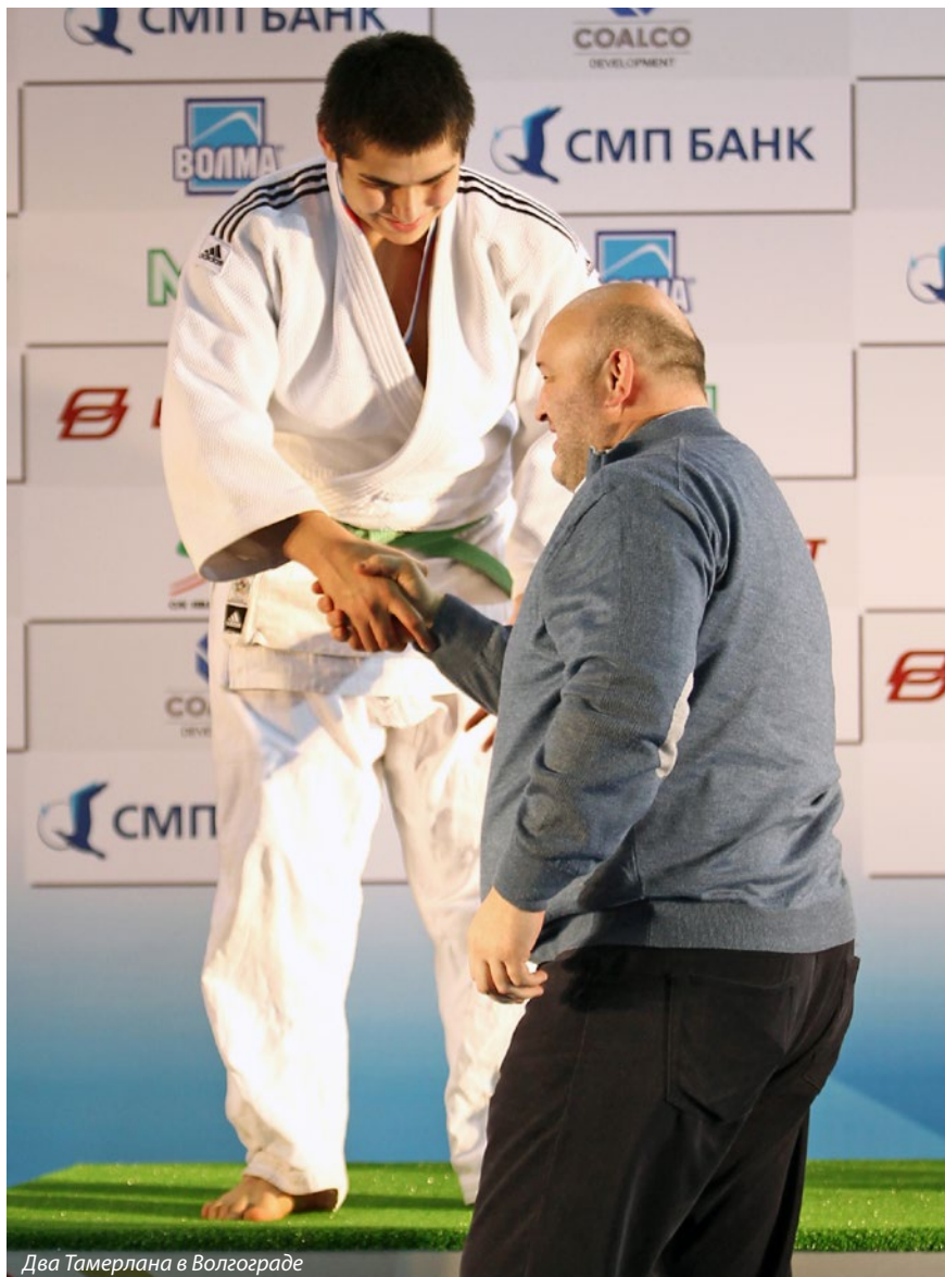
Два Тамерлана в Волгограде

— Два года назад на юношеской России в Волгограде Вас награждал другой, прославленный, Тамерлан — Тменов.